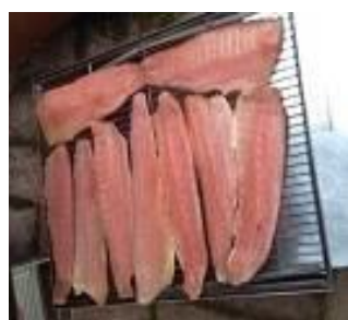
Filets de truites saumonées prêts à passer au fumage