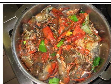
Préparation de la bisque d'écrevisses

N'hésitez pas à échanger avec nous sur notre savoir-faire et sur les poissons d'eau douce !