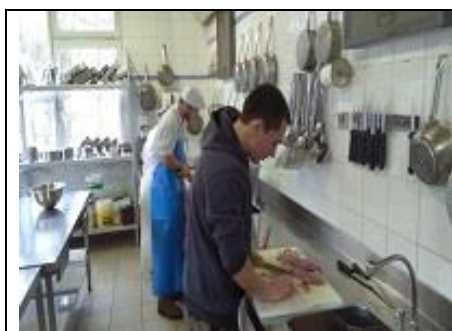
Filetage des carpes

Les stagiaires transforment des poissons achetés chez différents professionnels de la région : Pisciculture Beaume (La Chapelle sous chaux – 90), Pisciculture Guidat à Orbey (68) et Pêcherie Jacquier (74).